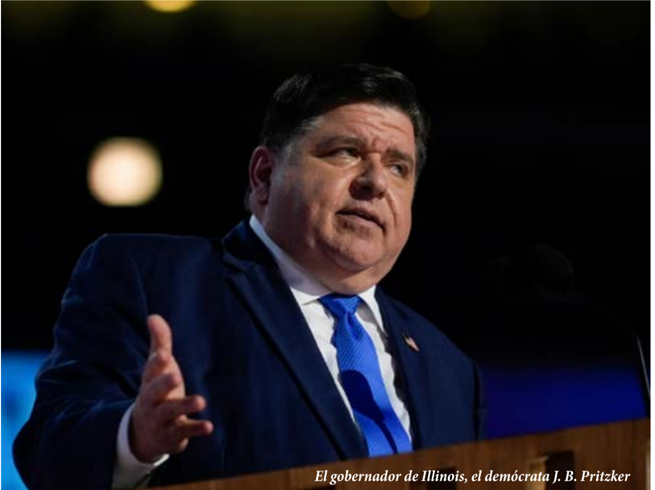
El gobernador de Illinois, el demócrata J. B. Pritzker