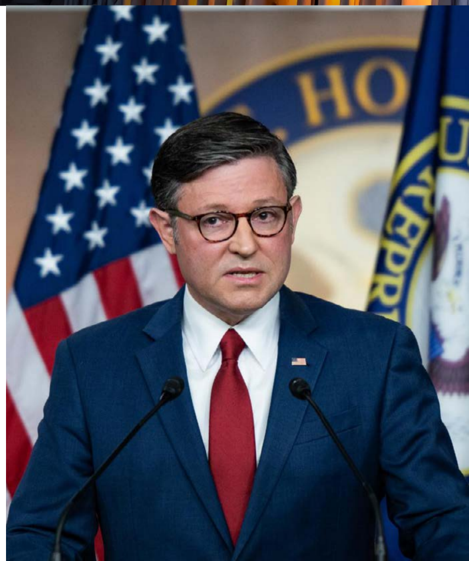
El líder de la Cámara de Representantes de Estados Unidos, el republicano Mike Johnson

Johnson también juramentará a la recién electa Adelita Grijalva (Arizona). Su voto podría forzar la publicación de archivos del caso Jeffrey Epstein, pero eso tardará al menos siete días legislativos.