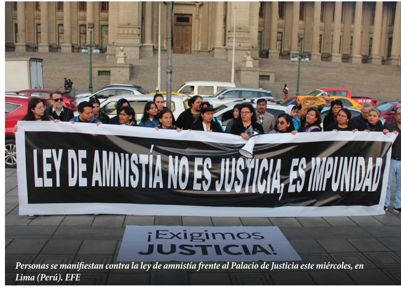
Personas se manifiestan contra la ley de amnistía frente al Palacio de Justicia este miércoles, en Lima (Perú).

La presidenta de Perú, Dina Boluarte, promulgó una amnistía para policías, militares y comités de autodefensa procesados o condenados por delitos cometidos entre 1980 y 2000 en la lucha contra Sendero Luminoso y el MRTA, desobedeciendo a la Corte IDH, que pidió suspender la ley. El Congreso, dominado por fuerzas conservadoras, impulsó la norma argumentando defensa de la soberanía. La medida beneficia a quienes no tengan sentencia firme o tengan más de 70 años, pero excluye casos de terrorismo y corrupción. La promulgación coincidió con los 40 años de la masacre de Accomarca, en la que militares ejecutaron a 69 campesinos. La ceremonia contó con la presencia de veteranos de operaciones emblemáticas como Chavín de Huántar.